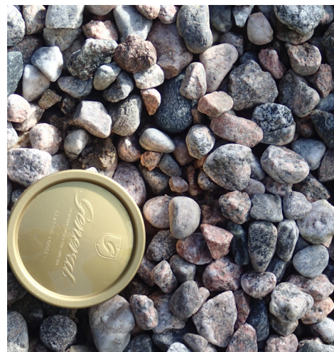
Lekgrus i lämplig storlek för mindre å.